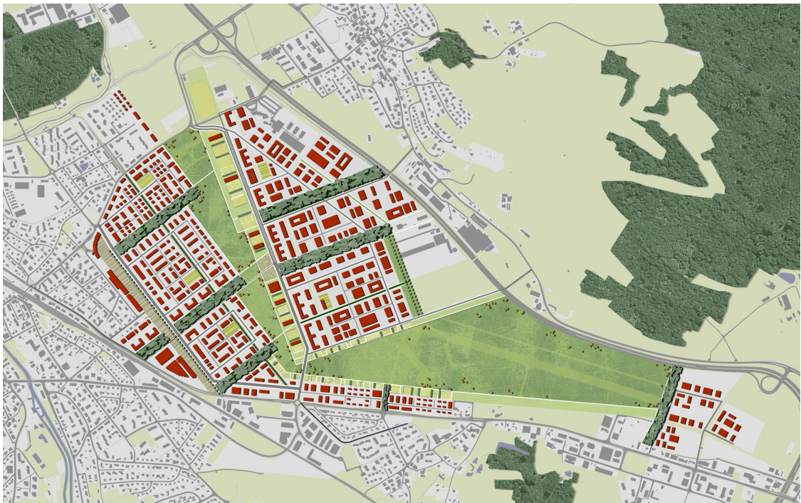
Städtebauliches Konzept ohne aviatische Nutzung

Auftraggeber: Baudirektion Kanton ZH, Amt für RO Planungsgebiet: 236 ha Planung: 2008